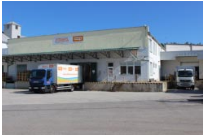
VO koloniál – expedice

Letní turistická sezona je vždy zkouškou nejen pro prodejny, ale i velkoobchody a dodavatele. Někteří výrobci nápojů dokonce hlásí překročení výrobních kapacit o desítky procent, což ve spojitosti s nedostatkem pracovníků není zcela příznivé.