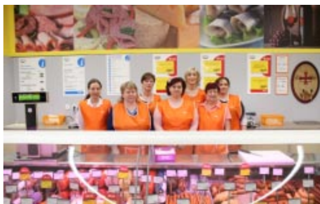
Personál prodejny COOP TIP Horní Planá

Pro IV. čtvrtletí 2018 plánuje družstvo ještě investovat další prostředky do supermarketu Terno Český Krumlov. V přístavbě supermarketu bude využito nových 150 m 2 plochy, bude zde otevřen nový další vchod do super-