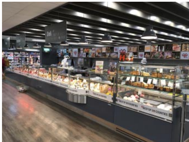
Obslužný pult v prodejně Bourton on the Water

Přínosný byl program zejména z pohledu péče o členskou základnu a práce s místními spolky, které družstvo podporuje a více tak podtrhuje důležitost družstva v regionu jako odpovědného podnikatele. Prodejny z pohledu jejich vybavenosti jsou na srovnatelné úrovni s Jednotou Kaplice. Rozdílnost však nastává v nabídce sortimentu, kde převažuje nabídka mraženého a chlazeného zboží, určeného k ohřevu a rychlé spotřebě. Ve větších supermarketech je kladen důraz na nabídku čerstvého zboží a regionálních výrobků. V malých prodejnách, srovnatelných s našimi TUTY a JEDNOTA však vůbec nenajdeme obslužné pulty a nabídka je zaměřena na balené zboží, pečivo, ovoce a zeleninu.