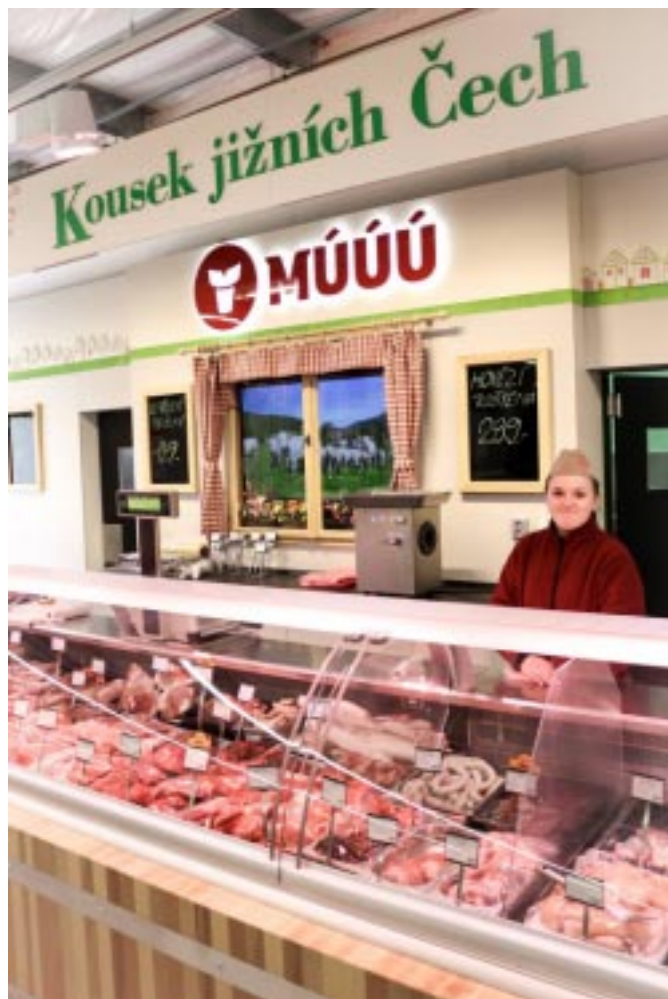
Nový obslužný pult dodavatele MÚÚÚ na Ternu ČR

Těchto významných výsledků jsme dosáhli zásluhou každodenní kvalitní práce našich zaměstnanců všech činností. Naše specifické zákaznické prostředí se silným nárůstem tržeb v letních prázdninových měsících vyžaduje i vyšší počet kvalifikovaných pracovníků zejména do prodejen oblasti lipenského jezera, kteří bohužel nejsou k dispozici. Uspokojit zákazníky a zajistit dostatek požadovaného zboží vyžaduje extrémní nasazení stálých pracovníků, kdy dosahují produktivitu práce několikrát vyšší než v mimosezonním období. S pomocí brigádníků, ale i pracovníků ústředí a výpomoci z prodejen mimo