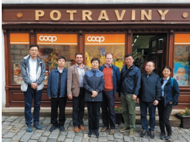
Zahraníční delegace před prodejnou COOP TUTY, Latrán, Český Krumlov