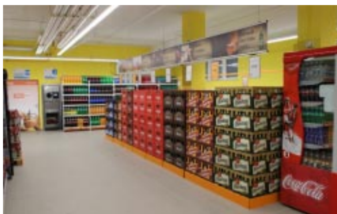
Úsek nápojů v COOP TIP Horní Planá

prodejní místnosti bylo provedeno nové předláždění podlahy, rekonstrukce byla provedena i u rozvodů elektrické energie, rozvodů centrálního vytápění a vody. Další inovací je změna osvětlení instalací LED svítidel s podstatnou úsporou elektrické energie a perfektní svítivosti. I z venkovního pohledu získal supermarket nový vzhled po úpravě fasády a zazdění energeticky nevohovujících výloh prodejny.