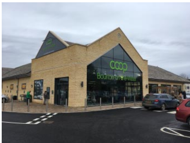
Nová prodejna ve městě Bourton on the Water

Jako první v Evropě jsme společně s Konzumem Ústí nad Orlicí, Jednotou České Budějovice a Jednotou Boskovic odstartovali výměnný pracovní program pro pracovníky