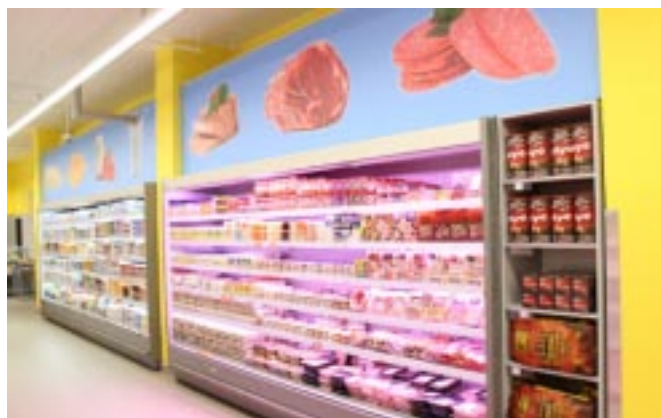
Úsek chlazeného sortimentu v COOP TIP Horní Planá

I letos získávají novou podobu další maloobchodní prodejny družstva. Zásadní změnou, rekonstrukcí a modernizací prošel v měsíci březnu a dubnu supermarket COOP TIP 095 v Horní Plané. Bylo realizováno rozšíření prodejní plochy o cca 50 m 2 k využití pro prodej nápojů a bylo změněno celkové dispoziční řešení prodejny. Byl vyčleněn větší prostor pro samoobslužný prodej sortimentu ovoce a zeleniny a sortimentu pečiva. Prodejna byla vybavena novým prodejním chladicím zařízením, regálovým zařízením, novým pokladním obslužným boxem. V rámci technické rekonstrukce a rozšíření prodejní plochy došlo ke zbourání dělící příčky mezi prodejním prostorem a skladem prodejny, bylo zrekonstruováno a přesunuto sociální zařízení, rozšířena zásobovací rampa, v celé