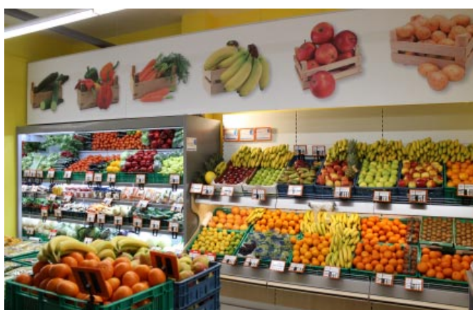
Úsek ovoce a zeleniny v COOP TIP Horní Planá

prodejní místnosti bylo provedeno nové předláždění podlahy, rekonstrukce byla provedena i u rozvodů elektrické energie, rozvodů centrálního vytápění a vody. Další inovací je změna osvětlení instalací LED svítidel s podstatnou úsporou elektrické energie a perfektní svítivosti. I z venkovního pohledu získal supermarket nový vzhled po úpravě fasády a zazdění energeticky nevohovujících výloh prodejny.